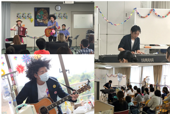
一般社団法人音楽のちから