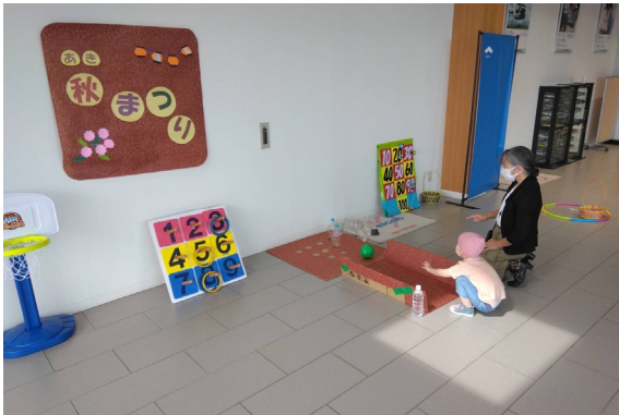
特定非営利活動法人東京子どもホスピスプロジェクト