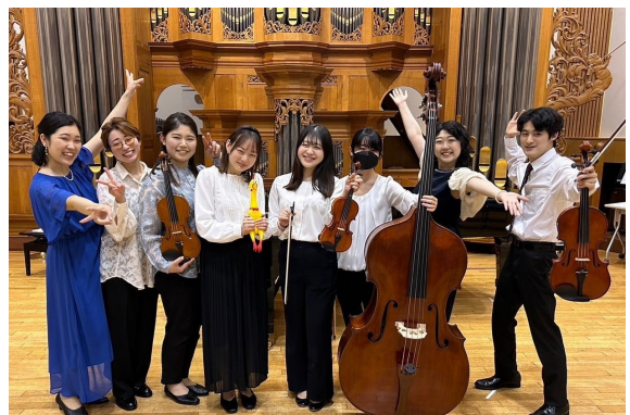
ライフウィズミュージック