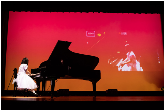
特定非営利活動法人生涯学習実践塾