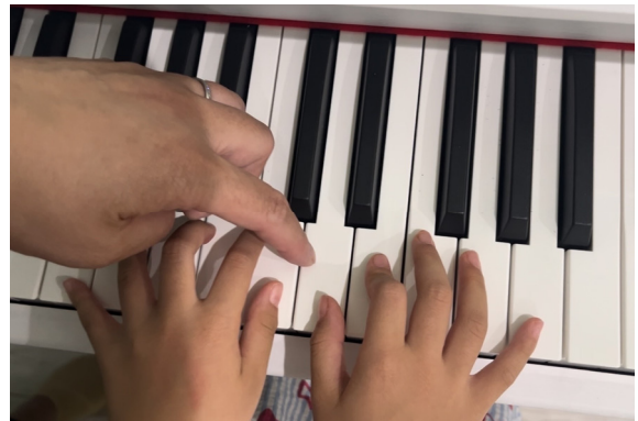
一般社団法人ストリートピアノドネーションズ