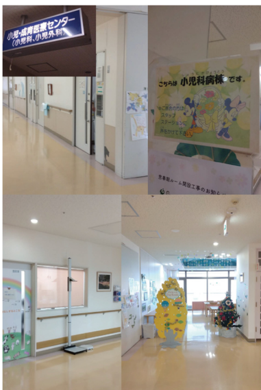
特定非営利活動法人群馬がんアカデミー