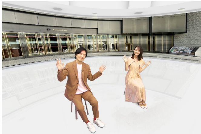
(2022年) ライブ配信番組 「こども音楽フェスティバルオンライン！」

清塚信也さんの公式アンバサダー就任は、2022年に開催された第1回「こども音楽フェスティバル」に続いて2回目。第1回開催時には公式アンバサダーの他、期間中全編ライブ配信された番組「こども音楽フェスティバルオンライン！」の配信総合パーソナリティとしても活躍。コンサート以外でも野外ステージでのパフォーマンスや配信スタジオでのトーク等、演奏のみならず知識とユーモアを交えた巧みな話術で来場者や配信視聴者を大いに楽しませ、結果来場者約3万人／配信視聴数約10万ファミリーと、クラシック音楽イベントとして異例の動員を記録しました。