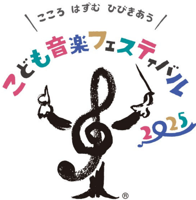
「こども音楽フェスティバル 2025」ロゴ

公益財団法人ソニー音楽財団（所在地：東京都千代田区、理事長：水野道訓）と公益財団法人サントリー芸術財団サントリーホール（所在地：東京都港区、館長：堤 剛）は、2025年5月3日（土・祝）～6日（火・休）の4日間、こどもを対象とした世界最大級のクラシック音楽の祭典「こども音楽フェスティバル 2025（英文名称：Music Festival for Children and Young People 2025）」をサントリーホール（東京都港区）およびその周辺にて開催します。