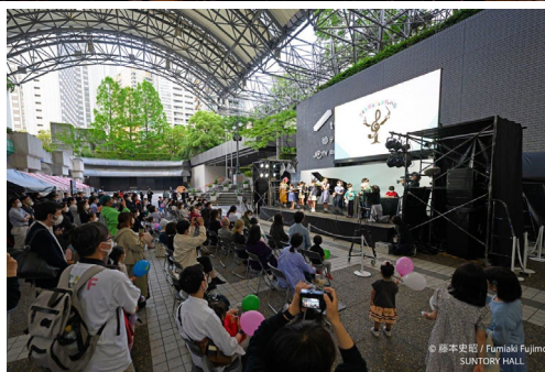
2022 年開催「こども音楽フェスティバル」の様子

「こども音楽フェスティバル 2025」では、“こころ はずむ ひびきあう”という言葉とともに音楽に触れる感動と、音楽を分かち合う喜びをこどもたちに伝えていきます。国内外の第一線で活躍する多数のアーティストを迎え、様々な年齢のこどもたちに向けたバラエティ豊かな公演や企画、誰もが音楽を楽しむことができるインクルーシブな取り組みを多数予定しております。詳細は、2024年6月21日（金）にOPENした公式WEBサイトで随時発表してまいります。