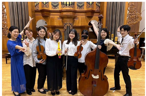
ライフウィズミュージック