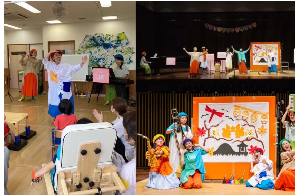
おとあーと研究室