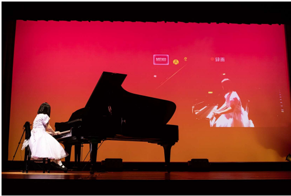
特定非営利活動法人生涯学習実践塾