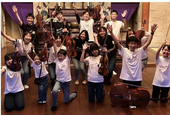
フェローオーケストラ