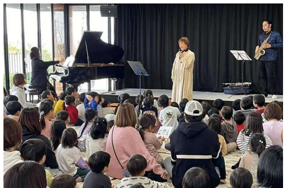
芸術の都 ACT くま 100