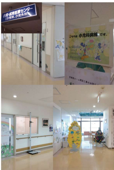
特定非営利活動法人群馬がんアカデミー