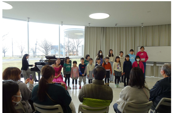
一般社団法人金澤芸術文化交流ネットサルーテ