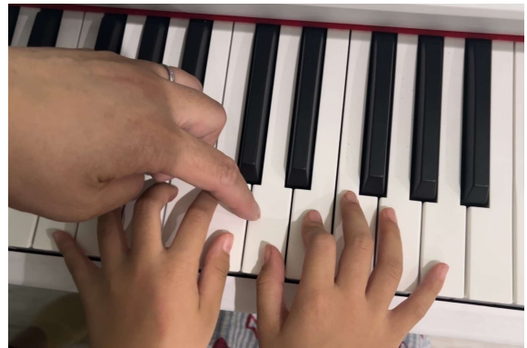
一般社団法人ストリートピアノドネーションズ