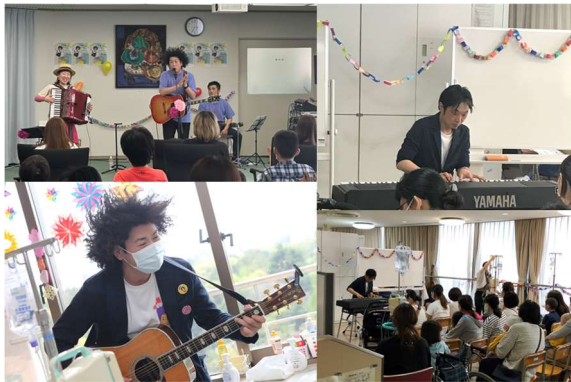
一般社団法人音楽のちから