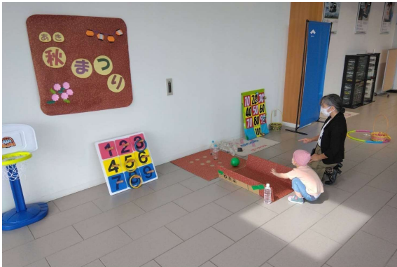
特定非営利活動法人東京子どもホスピスプロジェクト