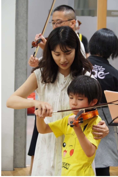
認定 NPO 法人あっちこっち